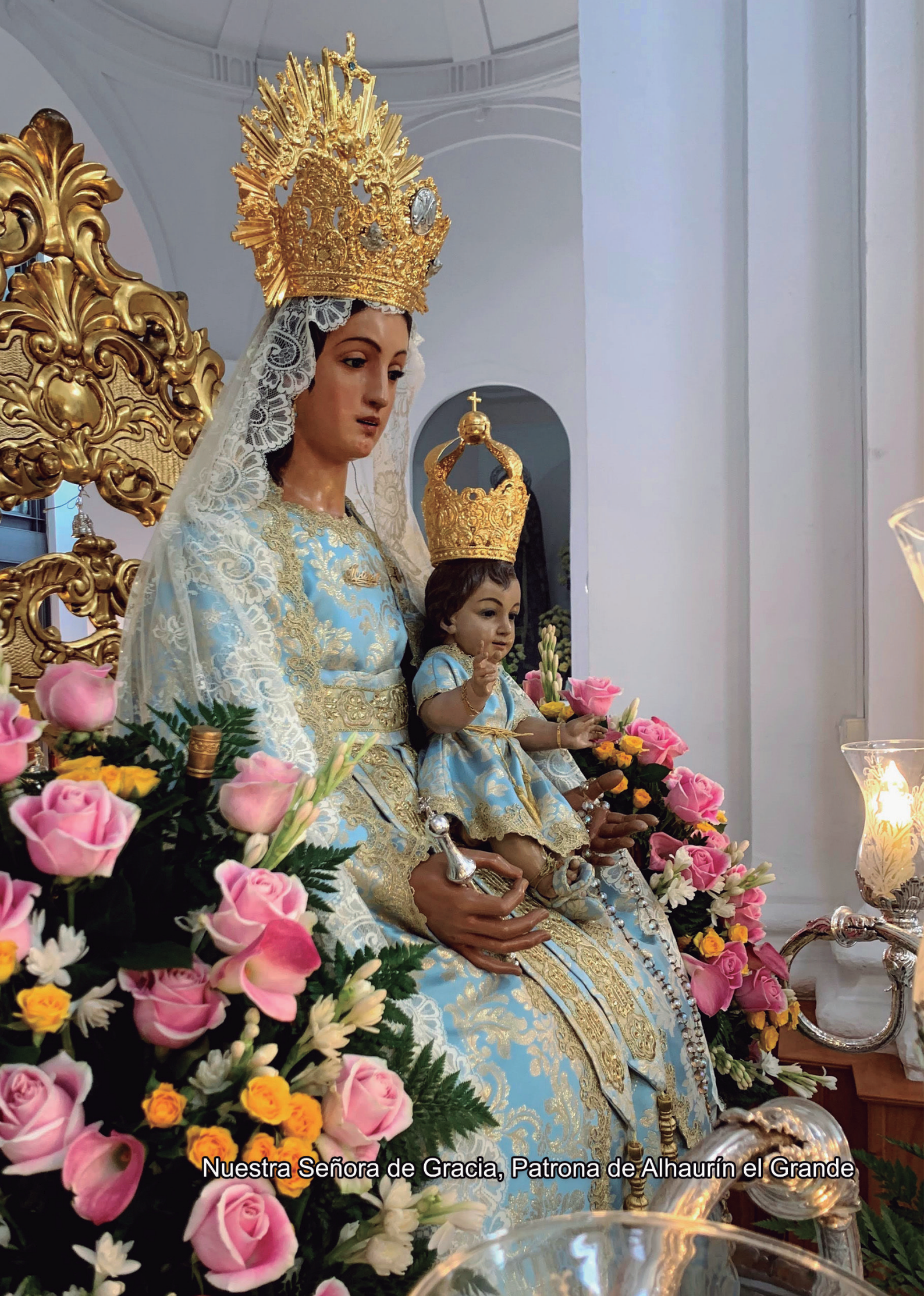
Nuestra Señora de Gracia, Patrona de Alhaurín el Grande