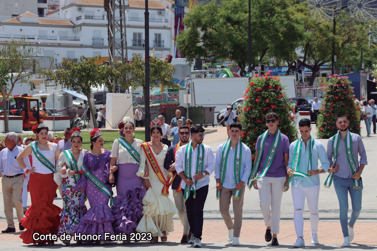
Corte de Honor Feria 2023