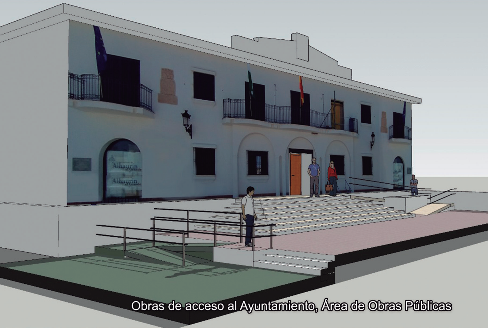
Obras de acceso al Ayuntamiento, Área de Obras Públicas