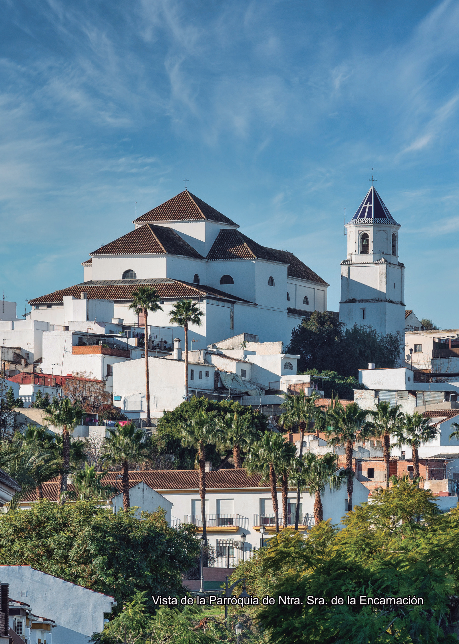
Vista de la Parróquia de Ntra. Sra. de la Encarnación