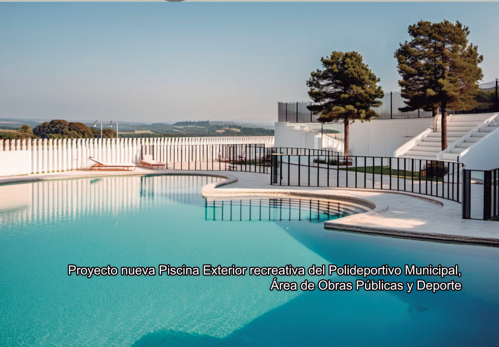
Proyecto nueva Piscina Exterior recreativa del Polideportivo Municipal, Área de Obras Públicas y Deporte