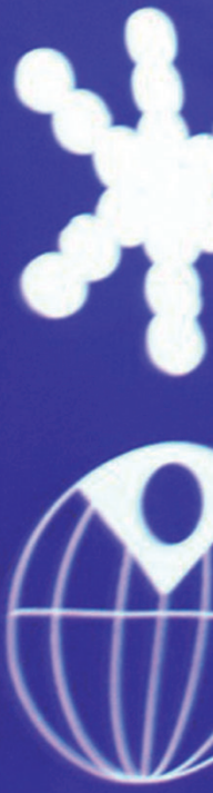
Caseta de la Juventud