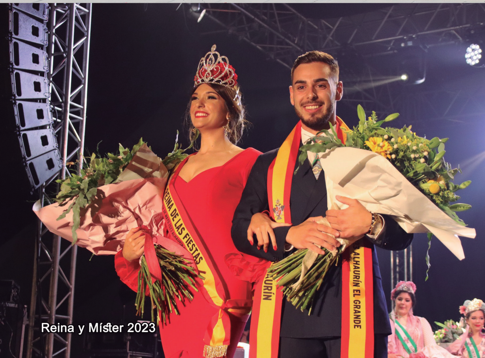
Reina y Míster 2023