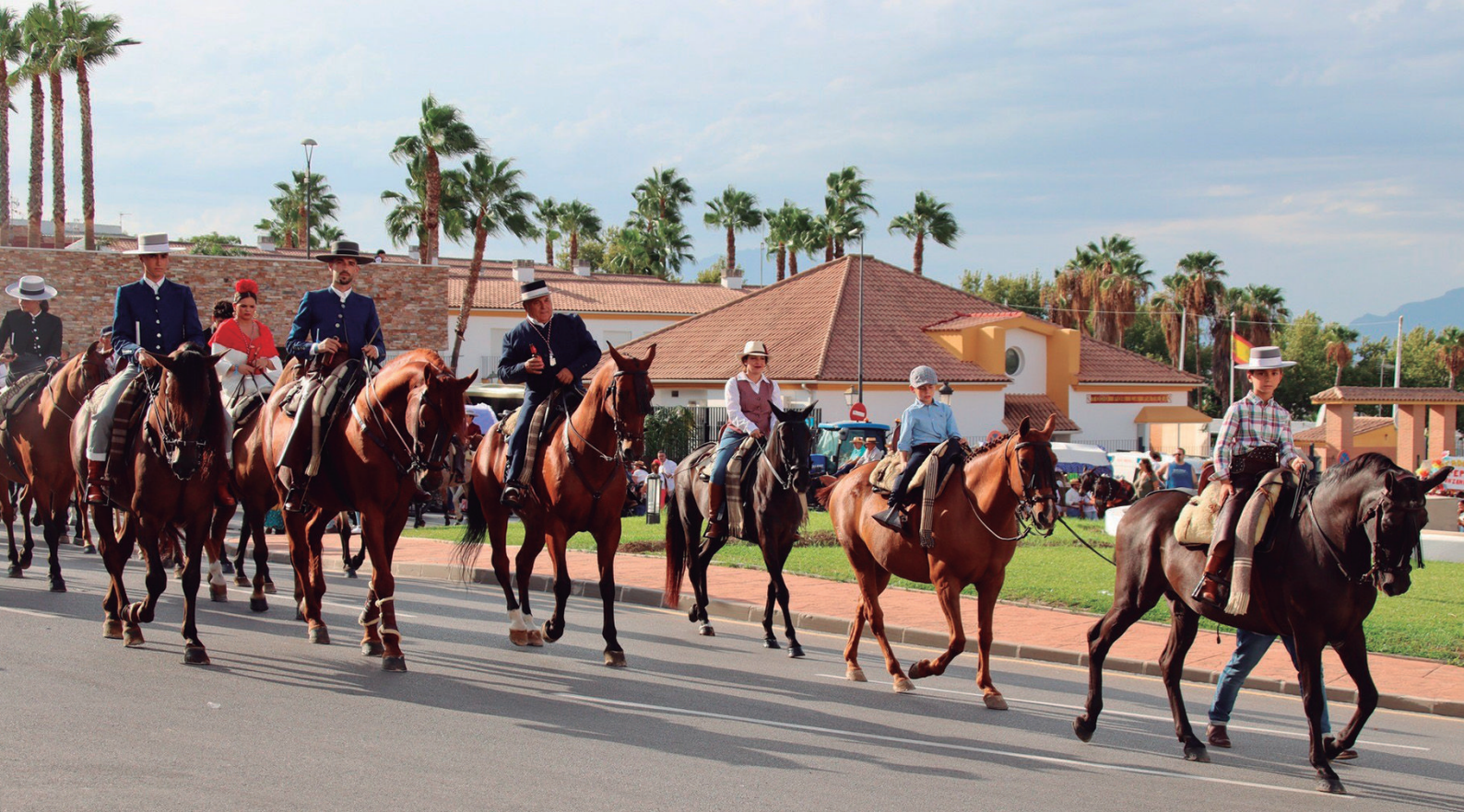
Romería del Cristo de las Agonías 2023